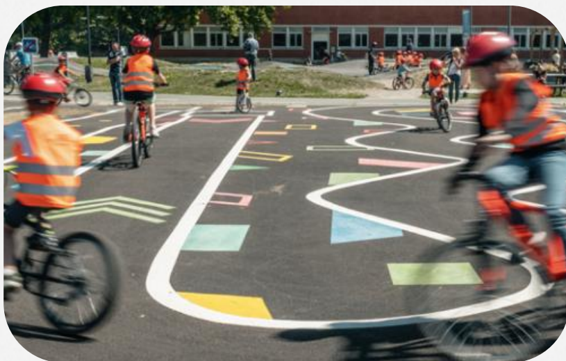
Image : Parc Mobi-ludique