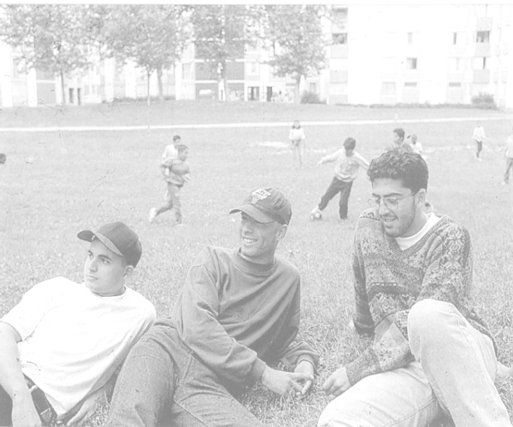
Un territoire marqué par l'identité locale.

La confrontation sportive dans les services sportifs de proximité ne se fait pas sur le modèle du club classique, c'est-à-dire dans un cadre relationnel et environnemental totalement étranger qui peut constituer une barrière pour les jeunes : le lieu du club est en effet un équipement public, éloigné de l'aire rassurante du foyer, impersonnel