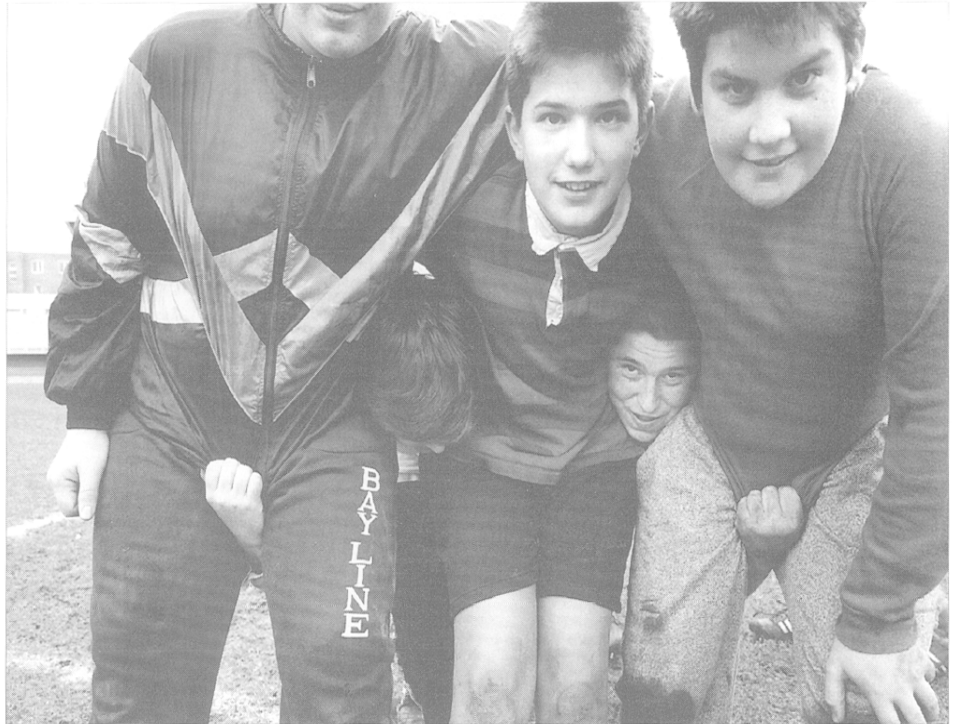
«Une osmose entre les pratiquants organisés et auto-organisés».

– 30 % de sportifs dans l’habitat social ; 40 % en milieu copropriétaire (on lit là les effets de la constitution sociale des populations) déjà parallèlement engagés dans une pratique en club, parfois depuis de nombreuses années. Pour certains, l’évolution sur le terrain de proximité constituait un prolongement de leur pratique en club, à l’instar d’un entraînement selon d’autres modalités. Les acquis du club pouvaient s’exprimer au quotidien, alors que l’adresse développée dans la rue pouvait les servir en club. Pour d’autres, il s’agissait simplement d’un espace ou d’un moment de «folie» qui venait compenser la tension et le sérieux des entraînements sportifs, un moyen de diversifier encore une boulimie de sport de tous les instants. Il faut se rappeler que cette population d’usagers, même dans l’habitat en copropriété, est globalement jeune et scolarisée, ce qui implique un taux de pratique sportive en club nécessairement important. Le fait que l’on retrouve des individus aux stratégies sportives simultanées, discordantes aux yeux de la pensée schématique des décideurs locaux, n’est alors guère étonnant.