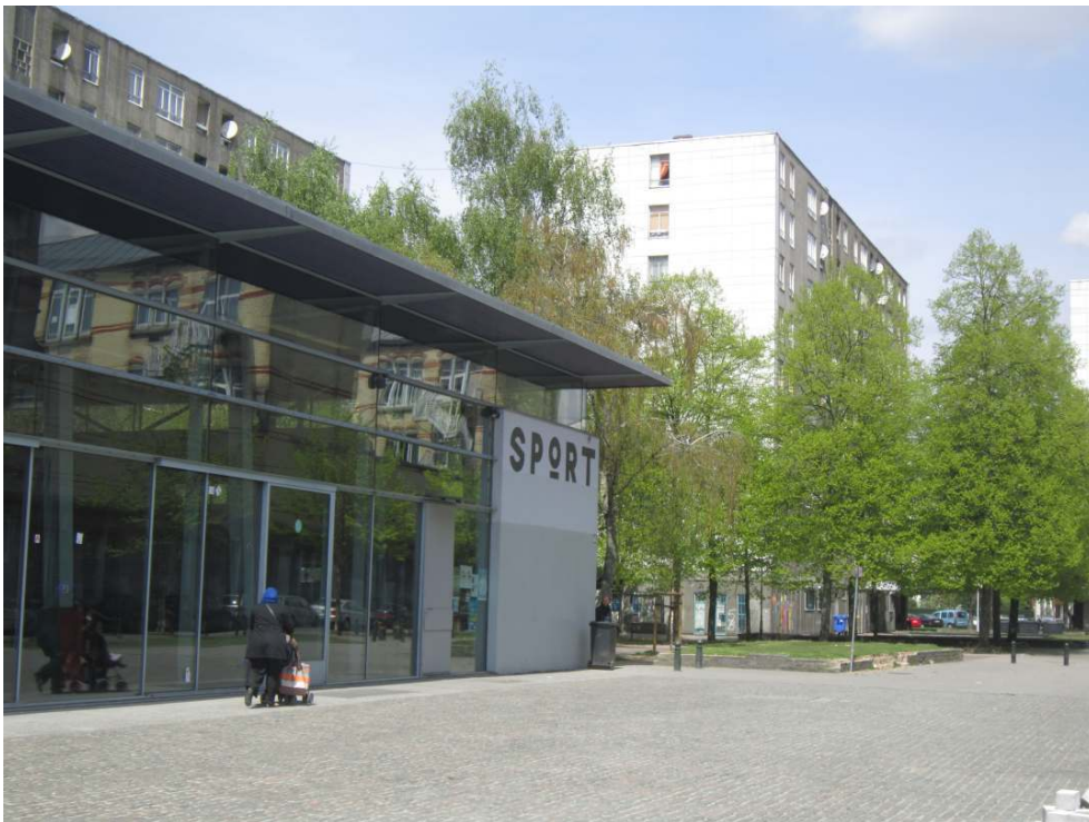
Illustration 3 : La salle de sport

réactions parfois très agressives (lettres de menace et endommagements effectifs et répétés de l'édifice). La réalisation de cette nouvelle salle a été confiée à un architecte désigné par concours qui a effectué le projet dans une optique de design social, au sens où le travail de mise en forme avait un objectif d'efficacité sociale : augmenter l'accessibilité symbolique de l'espace public dans lequel elle s'insère. L'avancée de l'édifice vers la rue et les autres caractéristiques formelles que nous allons voir sont les traductions spatiales matérielles de cet objectif.