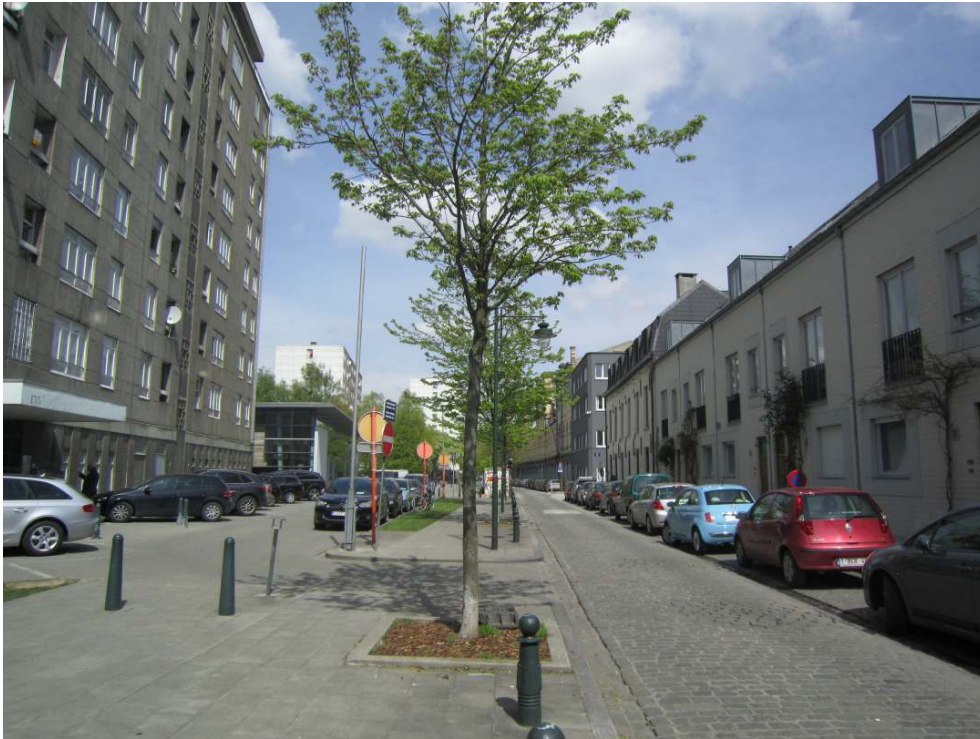
Zone frontière entre le « bastion populaire » du site social et la partie revitalisée du quartier