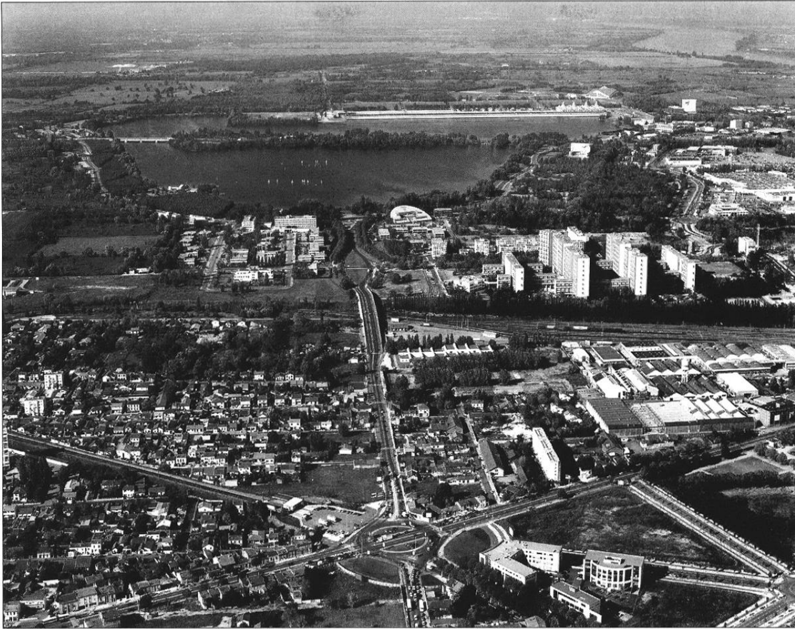
Le quartier du Grand Lac, en 1996.

séries d'exigences ; d'une part, la nécessité de développer les salles couvertes pour les sports collectifs, et d'autre part, celle de proposer aux établissements scolaires les constructions indispensables à la réalisation du tiers temps pédagogique, et à la généralisation du sport à l'école. Par ailleurs, les utilisateurs s'accordaient pour souhaiter que soient matériellement dissociées les salles couvertes, destinées à l'éducation physique, de celles destinées à la pratique des sports collectifs et des activités spécialisées. Le COSEC se présente donc comme un ensemble de salles et d'annexes fonctionnelles, pouvant évoluer par des adjonctions nouvelles ou la spécialisation de certaines de ces salles. Il permet une réalisation par tranches, tant sur le plan du programme pédagogique que sur celui des prestations techniques susceptibles d'être différées. Une fois achevé, le COSEC comporte un gymnase C traité en hall de sport, c'est-à-dire d'une manière allégée, un gymnase A de 20 m x 15, éventuellement une ou plusieurs salles d'entraînement de 15 x 12 m et leurs annexes. Une quinzaine de COSEC ont été construits dans l'agglomération, mais la majorité des gymnases et des salles polyvalentes sont de conception plus traditionnelle.