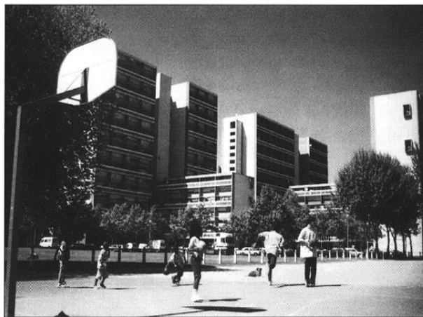
Les J-Sports de la Cité des Aubiers

Les équipements de proximité, à l'opposé des précédents, sont destinés à une population locale. Les « J Sports », installés au pied des immeubles collectifs des Aubiers et du Lauzun, correspondent à une forme d'installations devant mieux tenir compte des besoins de la population jeune résidente. Initiés par le ministère de la Jeunesse et des Sports en 1991, ils visent à implanter, au cœur des quartiers, de petits équipements ouverts en per-