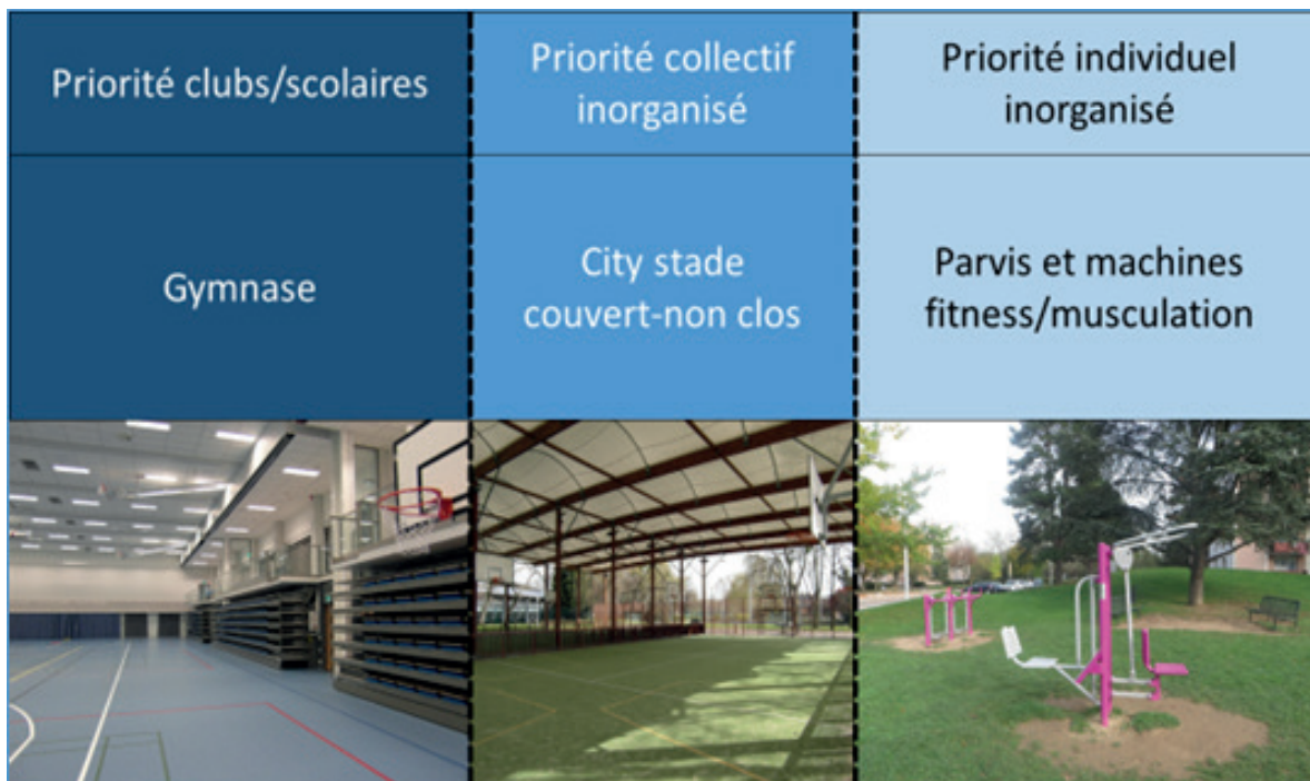
L'installation sportive progressive-dégressive (exemple fictif)

Largement inspiré d'un concept défini dans le Schéma de cohérence des équipements sportifs de Seine-Saint-Denis (SCOTES) 3 , le complexe sportif progressif-dégressif est un concept assez simple. Il consiste à regrouper au sein d'un même espace différentes fonctionnalités sportives intérieures et/ou couvertes et/ou extérieures. L'objectif est ici de créer des pôles vivants fréquentés par des publics diversifiés et dont personne ne se sent exclu, ce qui peut parfois être le cas lorsqu'une installation est réservée aux clubs ou lorsque des clubs sont contraints de céder des créneaux d'entraînement pour permettre une pratique libre.