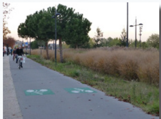
Piste cyclable « lente » (à gauche) et « rapide » (à droite) à Bordeaux