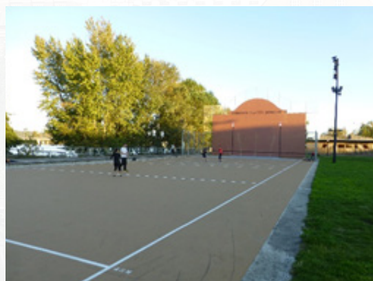
Vues du parc des sports Saint-Michel à Bordeaux

La construction d'équipements sportifs en bordure de fleuve est susceptible de renforcer l'attractivité d'un lieu donné. Cela génère un afflux de population. Cet élément plutôt positif peut poser toutefois des problèmes de conflits d'usage. Des rivalités peuvent naître pour l'utilisation de l'espace. Il est essentiel de s'assurer que la situation ne dégénère pas, sans, pour autant, effacer l'aspect ouvert des installations. La municipalité bordelaise a pris une mesure en ce sens et a mis en place un système d'animation et de régulation. Des agents municipaux sont affectés à ces tâches. Disposant d'un local destiné au stockage de matériel, ils peuvent prêter divers ustensiles (dont des ballons) aux usagers. Le prêt est intégralement gratuit et ne nécessite que le dépôt d'une pièce d'identité en guise de caution. Ils assurent également, en cas d'affluence, la mise en place de « créneaux » sur les terrains de jeu : l'objectif est d'éviter des occupations trop longues (supérieures à 45 minutes) et de permettre à chacun de disposer d'un temps de jeu. Selon les responsables bordelais, ce système donne satisfaction et se révèle même essentiel pour le bon fonctionnement du parc. Une transposition de l'exemple ne pourrait, selon nos interlocuteurs aquitains, n'être viable qu'à la condition que des animateurs puissent être déployés sur site.