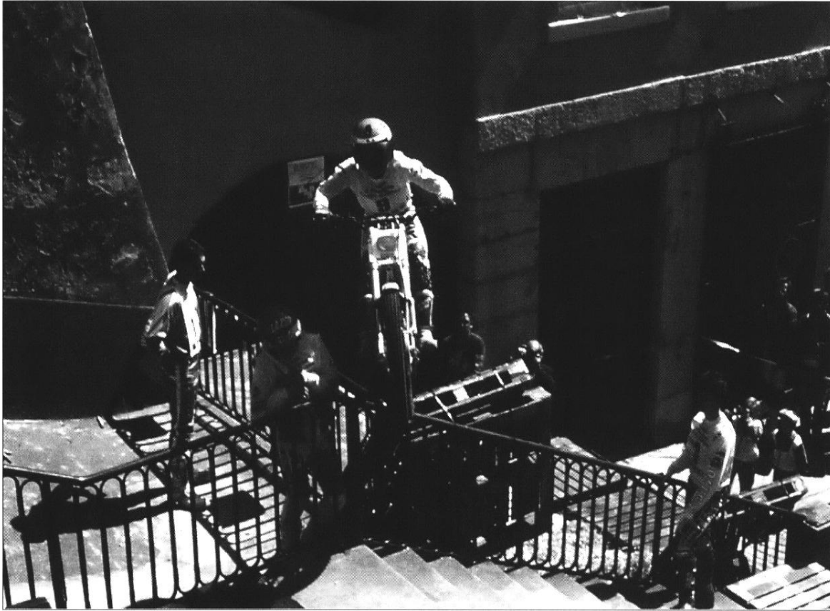
Bicross dans les escaliers de la Croix Rousse à Lyon.

même famille des activités de glisse et se retrouvent avec skaters et rollers lors de certains « Contests » 20 ou de séquences d'entraînements.